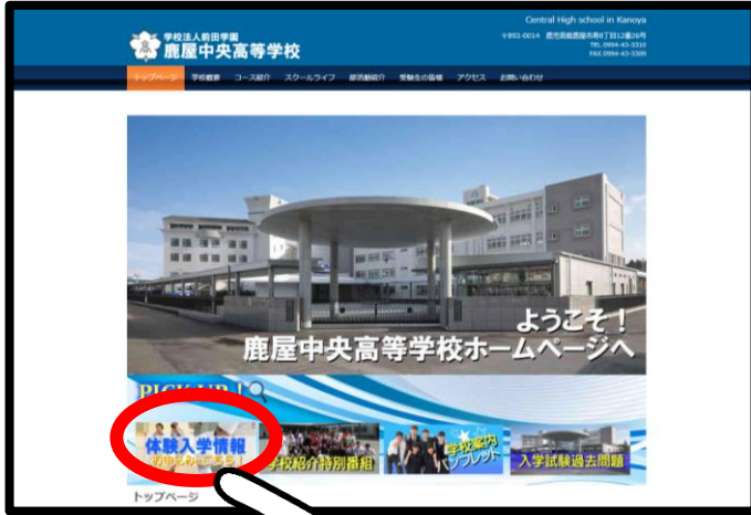
■ホームページ(TOP画面)